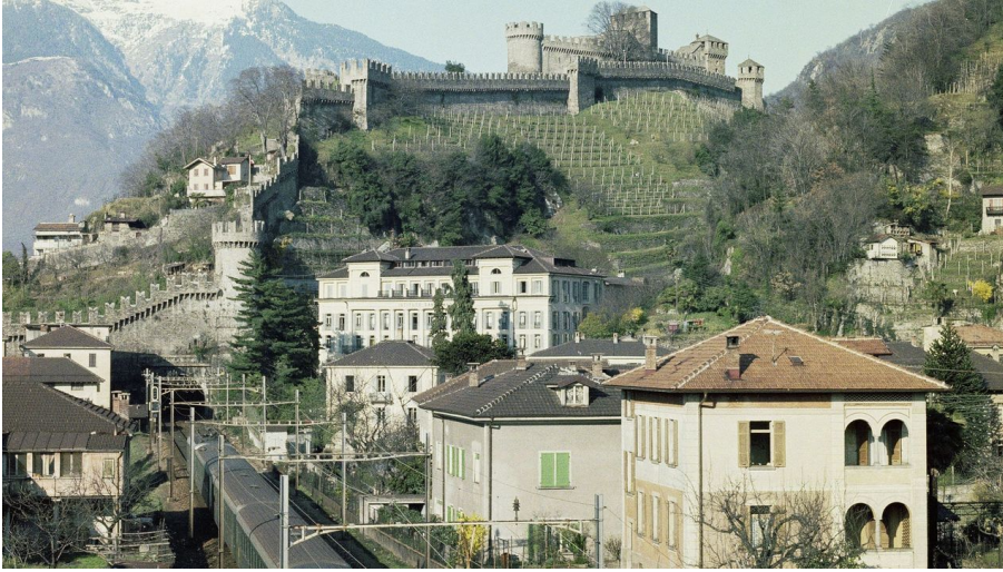
Bellinzona: Hinter dem Personenzug thront die Montebello-Burg | Bellinzona: derrière le train de voyageurs trône le château de Montebello | Bellinzona: dietro il treno passeggeri troneggia il Castello di Montebello, ≈ 1975.