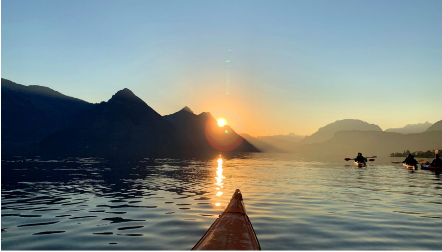
IMG 8815