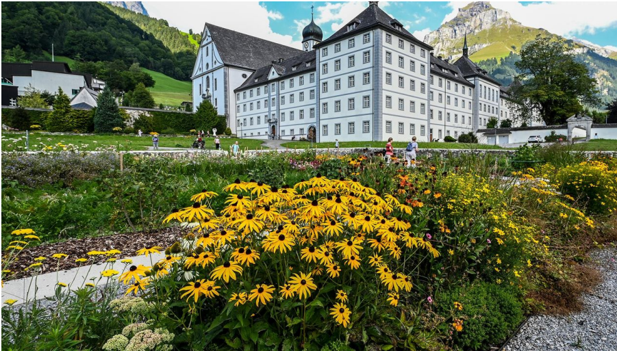
Klostergarten 4