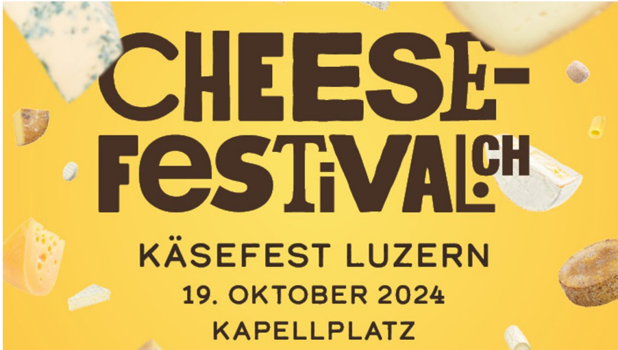
CF Käsefest Luzern Button 60x50mm