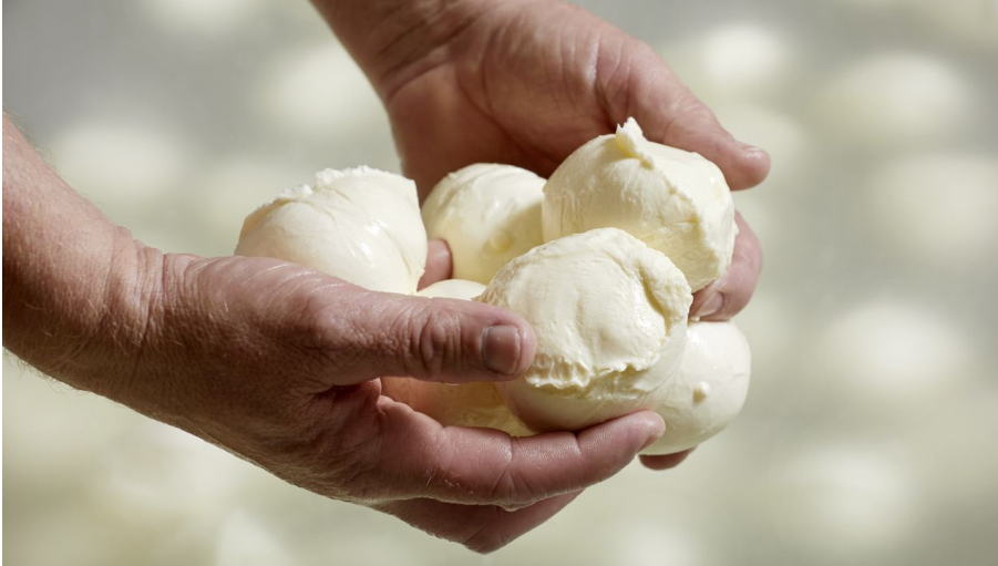
Stellen Sie Ihr eigenes Mutschli, einen Mozzarella oder ein Fondue her.