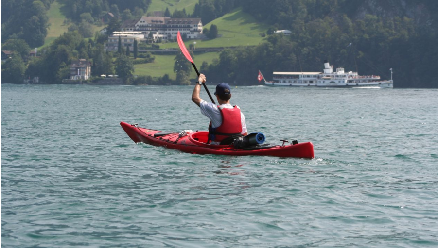
Im Seekajak beladen mit allem Gepäck für eine Nacht draussen paddeln wir zum Übernachtungsplatz.