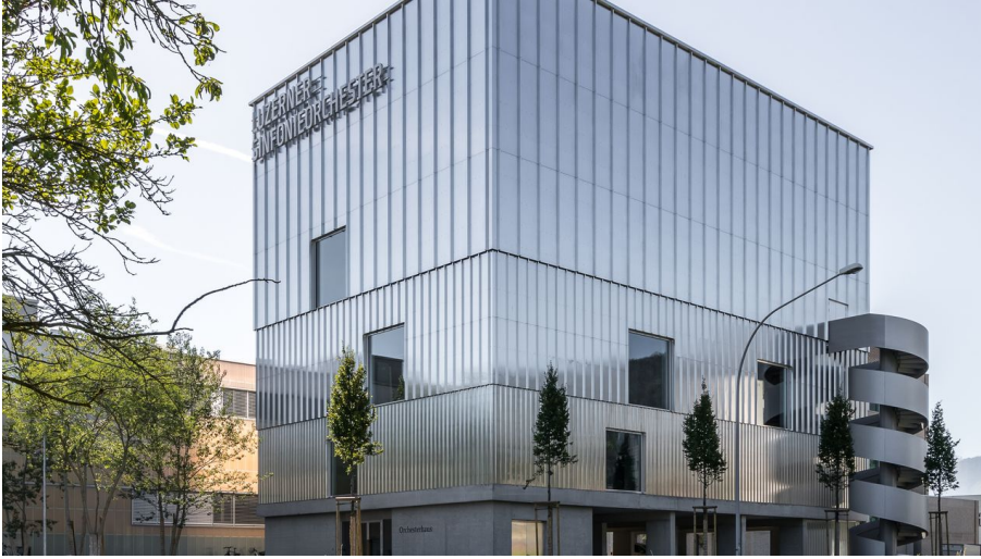
HSLU 20200708 512A2342 al 300