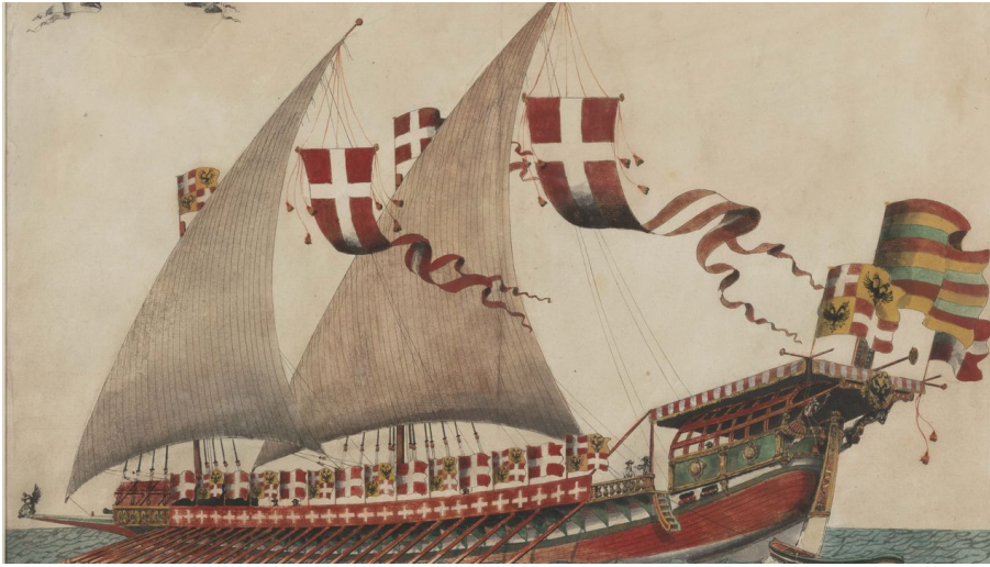
Jean Pimodan (Lebensdaten unbekannt): Galeere, Aquarell, Sammlung Philipp Keller, Verkehrsarchiv, Verkehrshaus der Schweiz, Inv. VA-40993