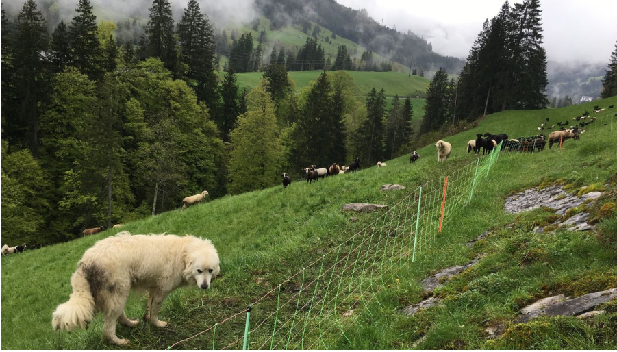
Kurs Herdenschutzhunde