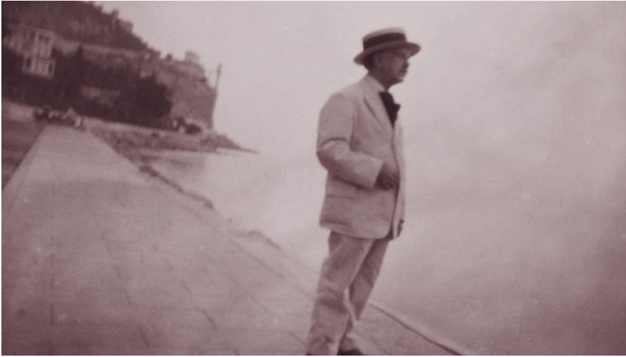
LouisVierne LeDernierRomantique