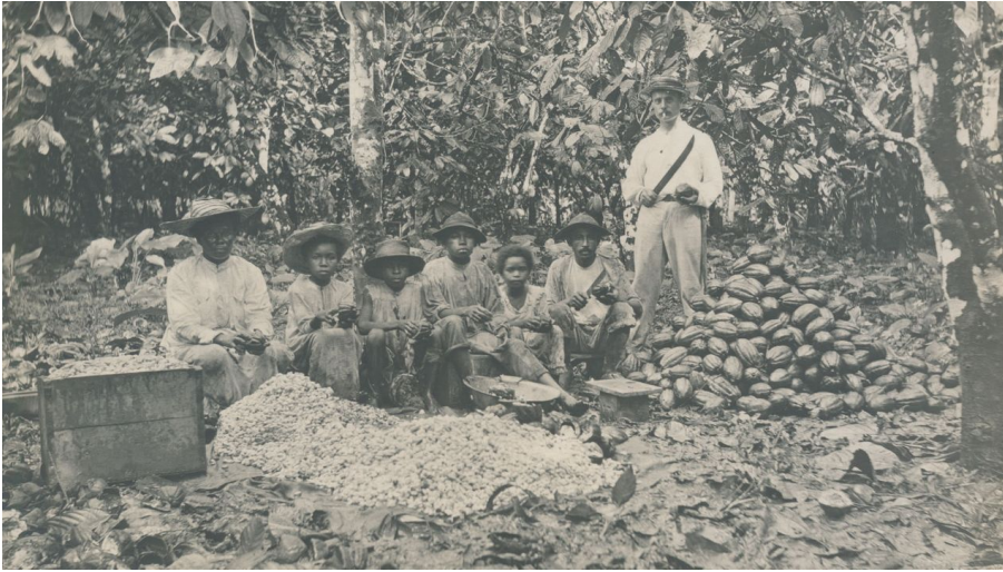
Aufschlagen von Kakaofrüchten, Bahia, Brasilien, um 1900 Photographie Sammlung Philipp Keller, Verkehrsarchiv, Verkehrshaus der Schweiz - © Guidle.com