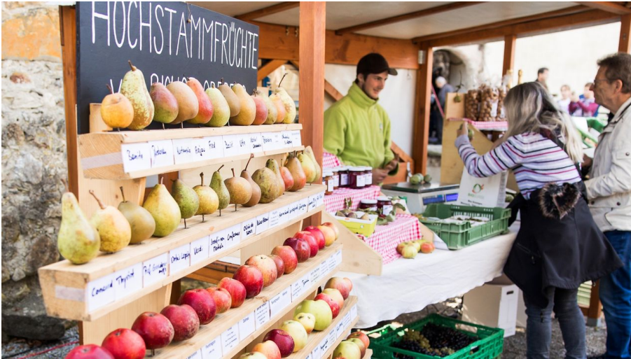
Mosttage und Herbstmarkt