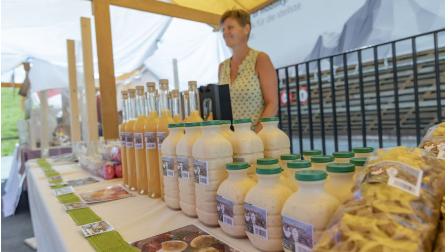
Naturproduktmarkt Stoos