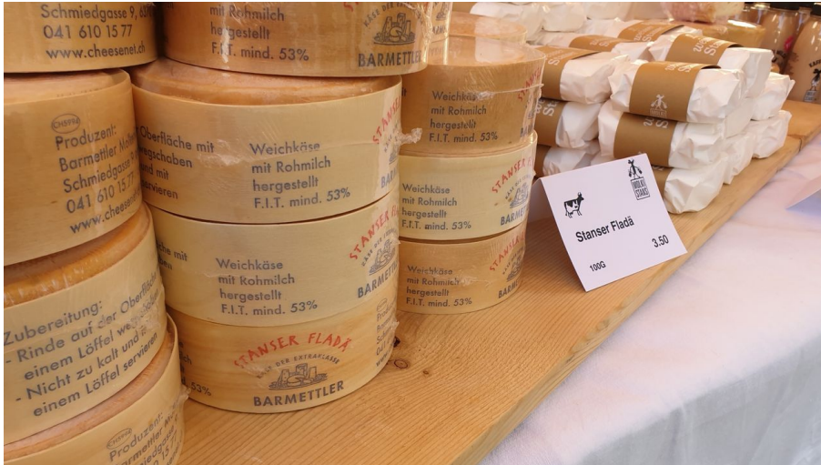
Impression vom 1. Nidwaldner GenussMarkt in Stans