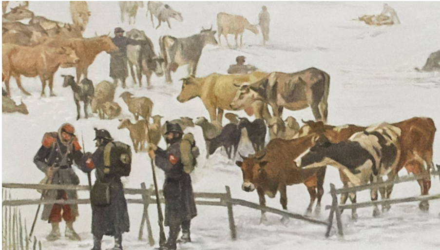
Bourbaki Panorama OekoFuehrung - © GuidleProxy