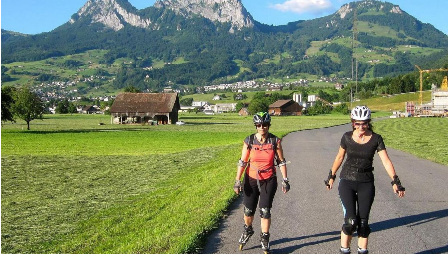
Inline-Skating Schwyz