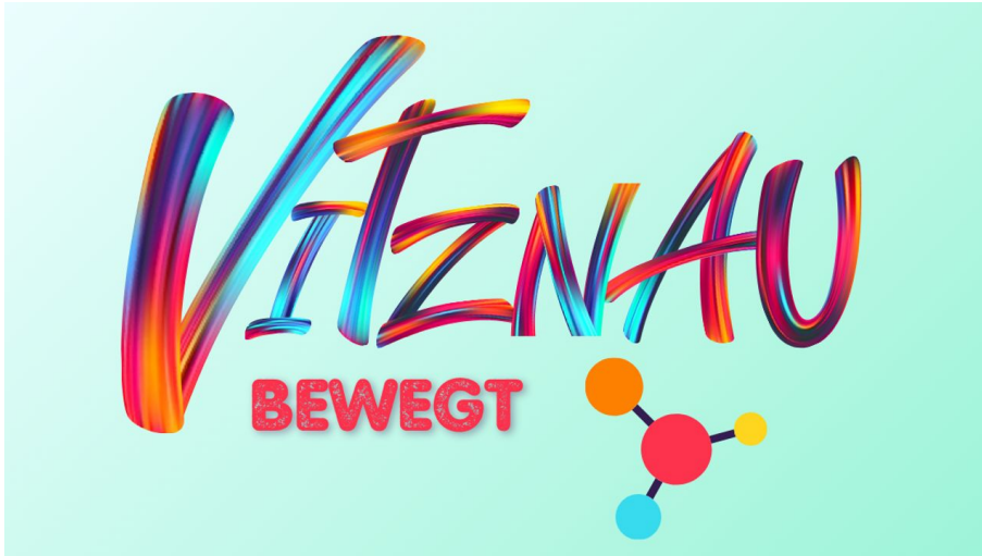
Vitznau bewegt Logo bunt[4677]