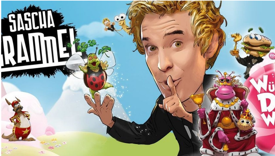
Resize 2024 02 09T182111 772