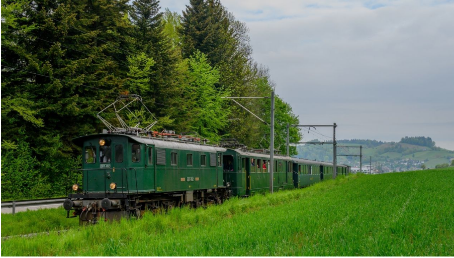
Unsere Be 4/4 als Vorspann vor unserem Reisezug