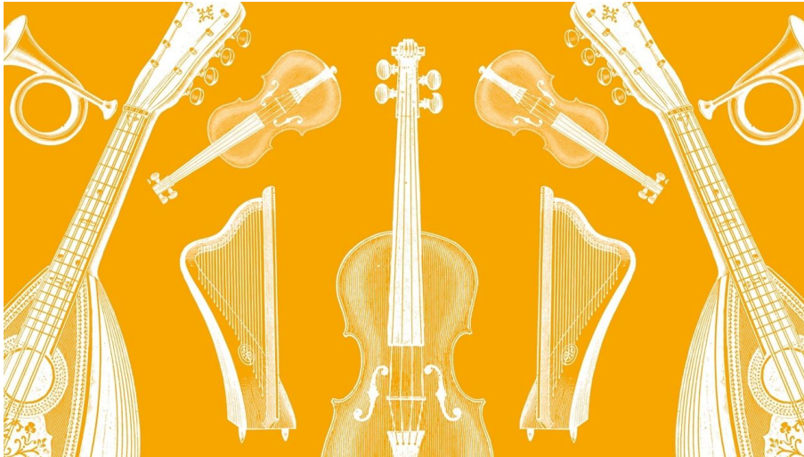
Schweizer Schlössertag - © Guidle.com