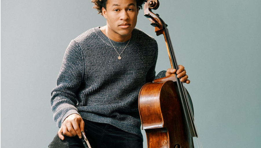
Sheku Kanneh-Mason