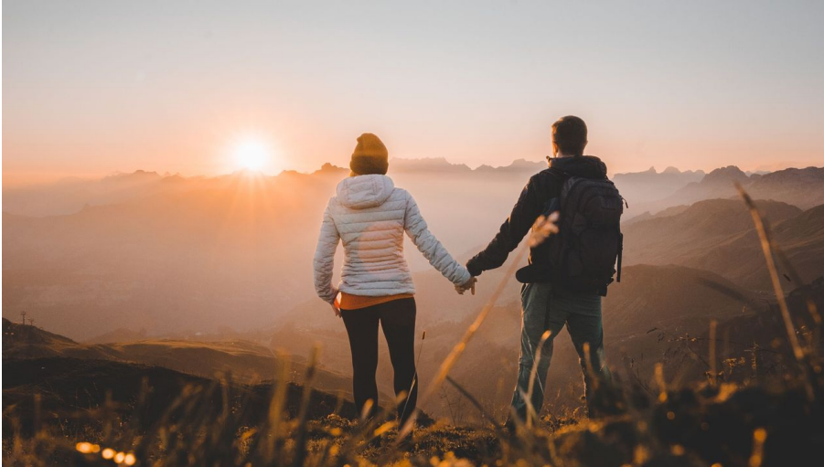
Computerformat 4 3 Sonnenaufgang Fronalpstock