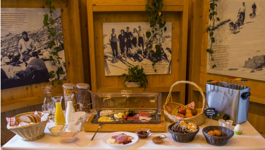
Sonntags Brunch