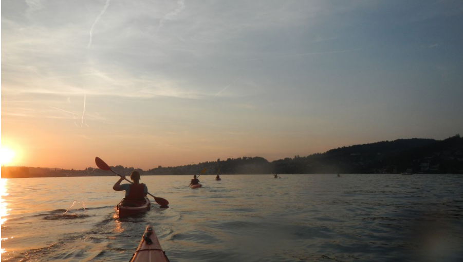
Sunset-Paddeln in Luzern