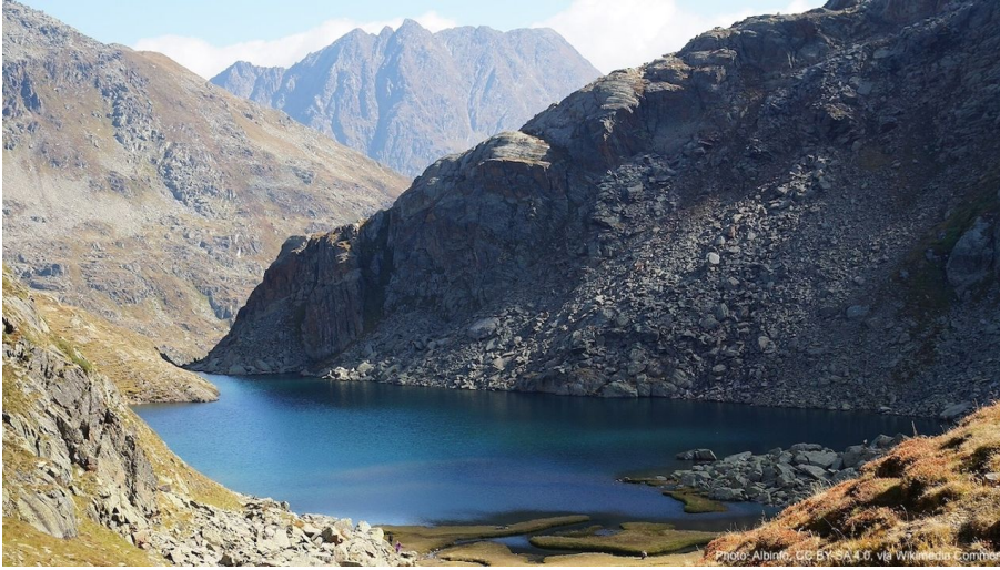
Tomasee 1 Klein by Albinfo creativecommons4 - © GuidleProxy