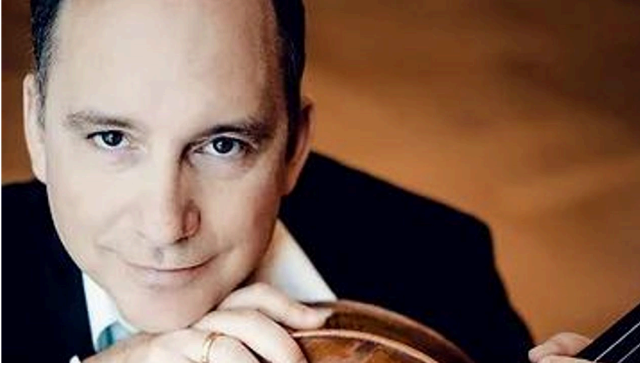
Konzert 1