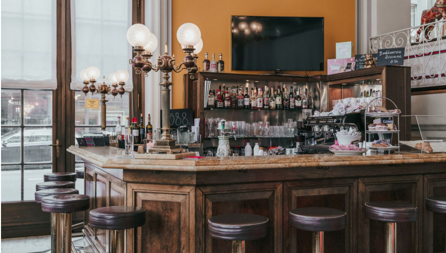
Café César Luzern