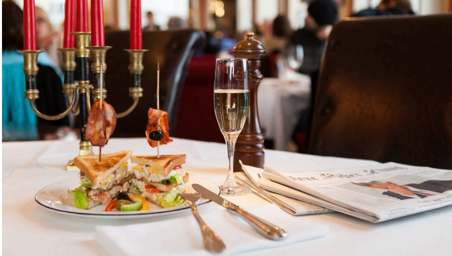
Café de Ville