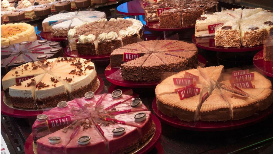
Heini Bild