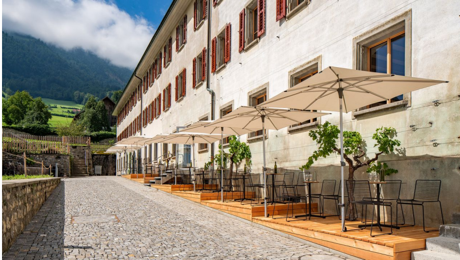
CULINARIUM ALPINUM_Klostergarten_Stans_Nidwalden.jpg