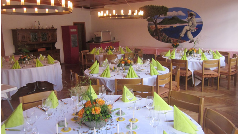
da Fusco Ristorante italiano Willisau