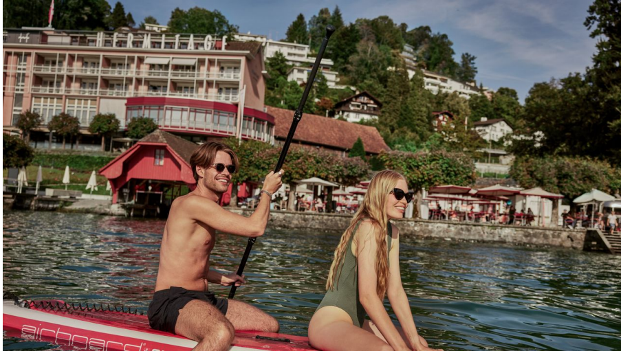
HERMITAGE Beach Club