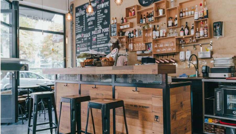
Hinicht - © Luzern Tourismus | Laila Bosco, Laila Bosco / LTAG