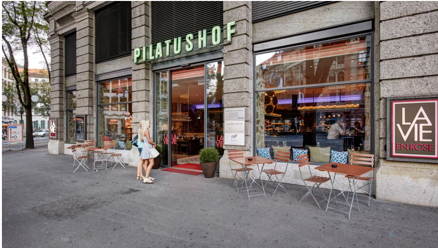
La vie en rose.jpg - © Copyright by Confiseur Bachmann AG / AURA Fotoagentur, Gabriel Ammon / AURA Fotoagentur