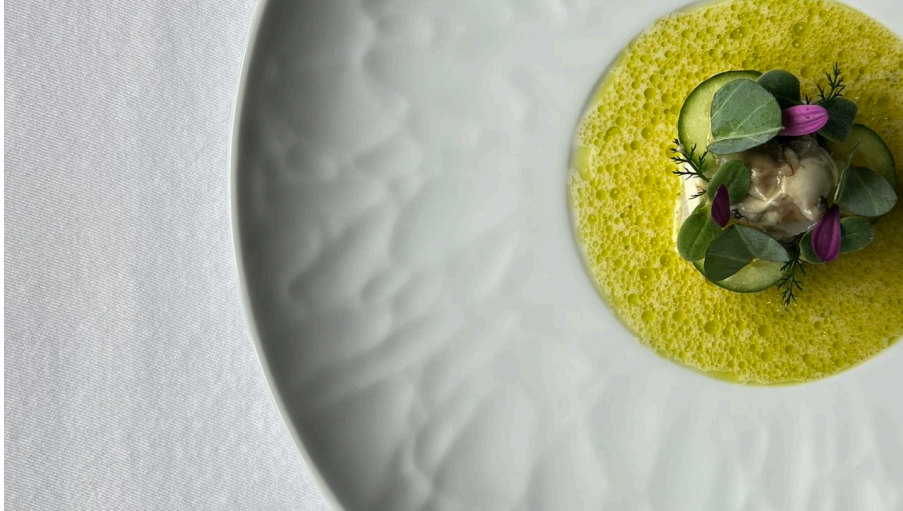
Forelle Maihöfli