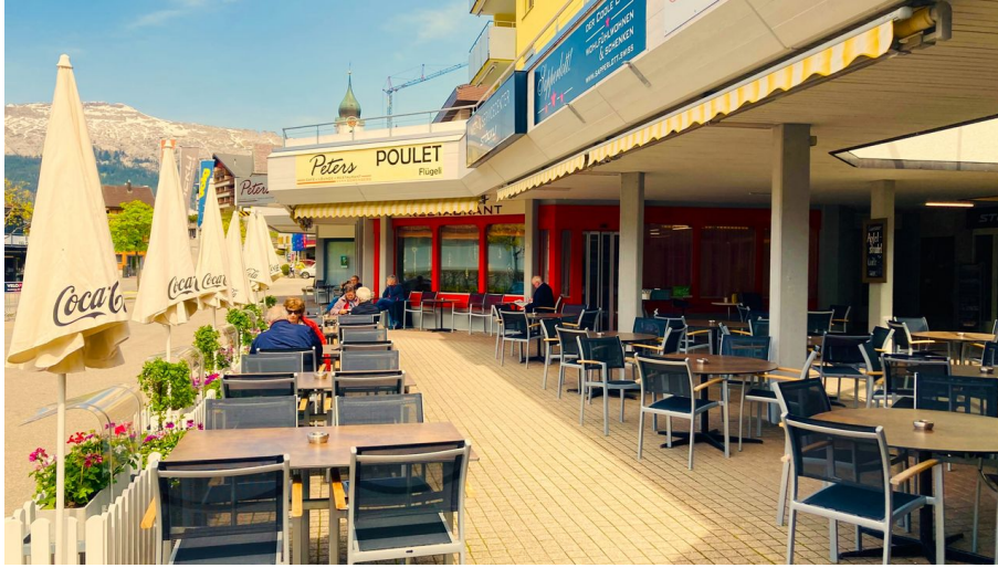
Café Lounge Restaurant Peters - © Café Lounge Restaurant Peters - https://www.peters-soerenberg.ch/