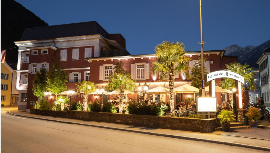
Pizzeria Wilhelm Tell_C_Gastromaxx GmbH (2).jpg