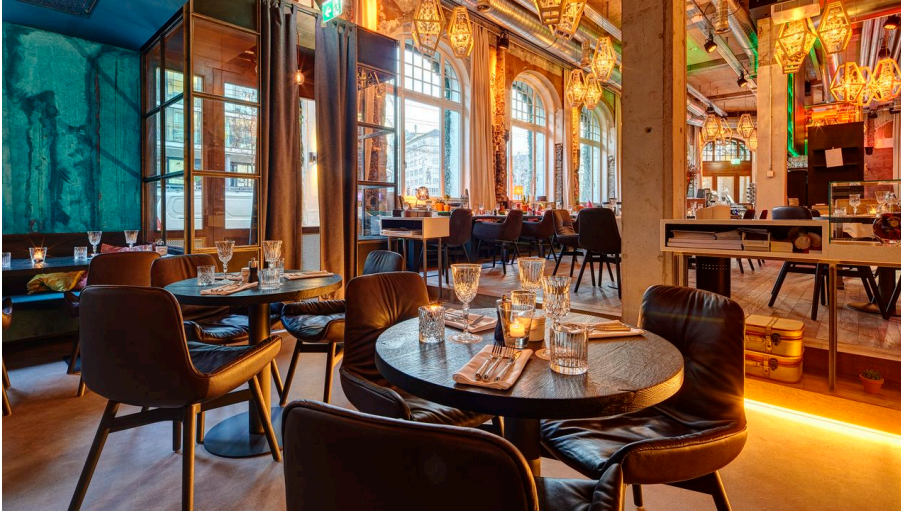
ANKER Restaurant