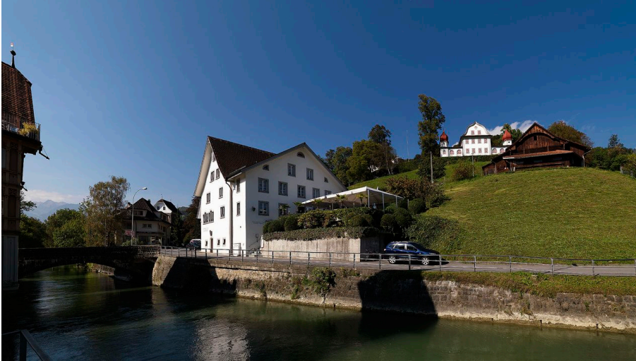
Aussenansicht Restaurant Pappalappa