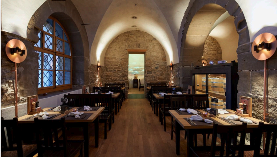
Rathaus Brauerei Luzern.jpg