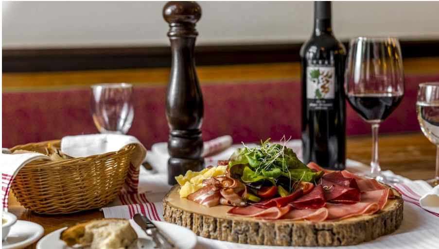
Rebstock Restaurant