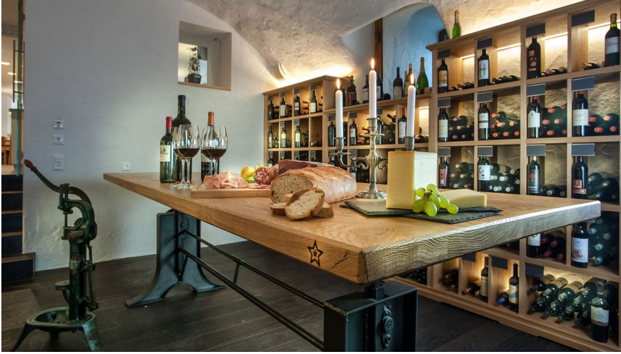
Restaurant Sternen