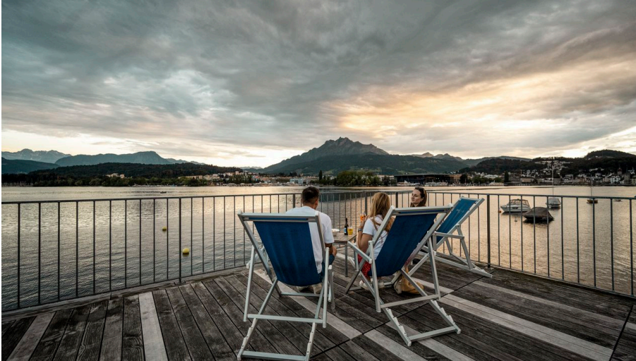
Seebad Luzern