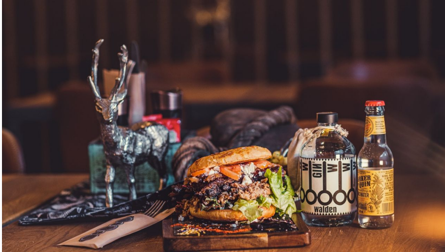
Seehuis Burger Giswil