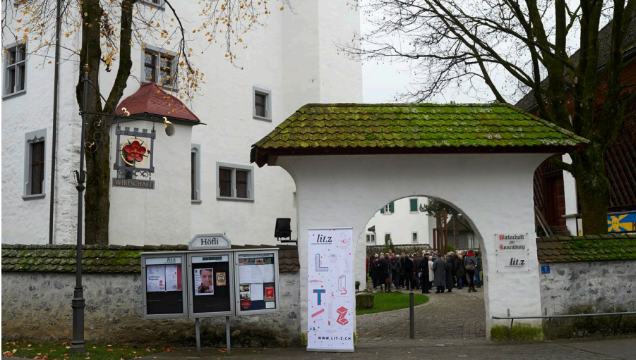
Wirtschaft zur Rosenberg aussen