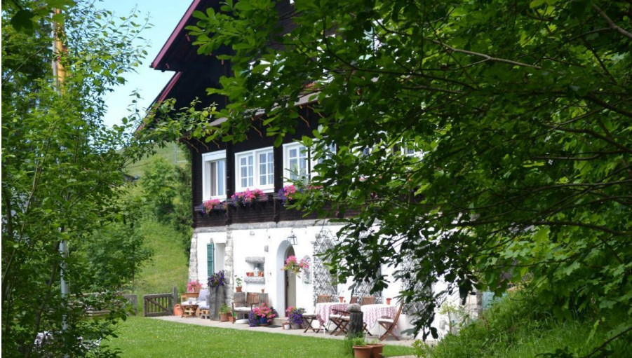
Das Chalet im Sommer