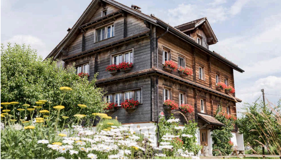
Haus im Sommerkleid