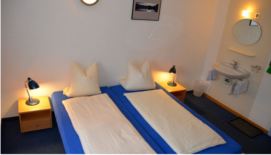
Zimmer Eco