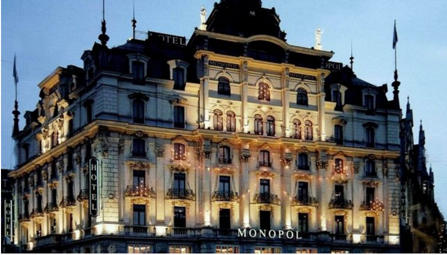
Hotel MONOPOL Lucerne / Hotel MONOPOL Luzern