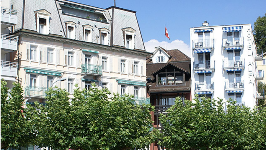
Hotel Schmid & Alfa